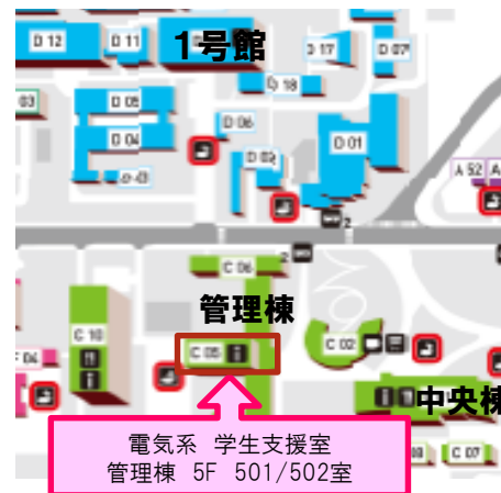
電子情報システム・応物系