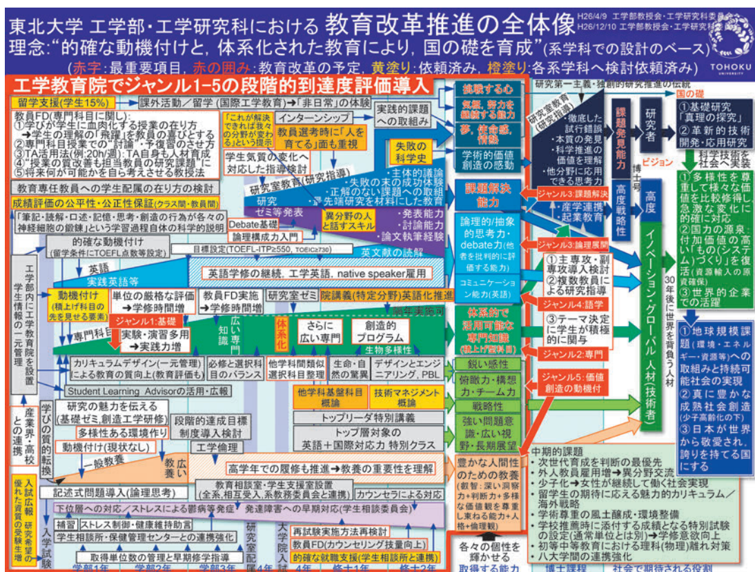
図2. 東北大学工学研究科・工学部における教育改革のグランドデザイン (横軸は学年)

今後も我が国の厳しい状況は続くと考えられるが、次代を託す優れた若者を輩出し、また教員が一層素晴らしい研究成果を挙げ、さらに職場を活性化させることで、「 真に豊かな持続可能社会 」の創造に貢献できるよう、研究科と学部が全力で取り組んでいく所存です。引き続き皆様のご支援とご鞭撻をどうぞよろしくお願い致します。